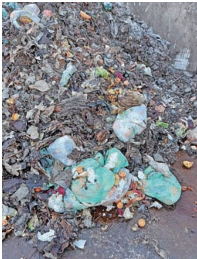
Komunalna podjetja se srečujejo s slabo ločenimi biološkimi odpadki.

Biološke odpadke lahko s procesom kompostiranja sami predelamo v uporabno surovino. Kompost uporabljamo kot domače gnojilo, ki vsebuje 70–80 odstotkov organske mase, bogate z vsemi osnovnimi hranili, kot so dušik, fosfor, kalij in kalcij. V kompostu je velika količina humusa, ki absorbira vlago v rastlinskem mineralu, potrebnem za rast.