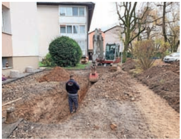
Vodovod obnavljajo zaradi dotrajanosti.