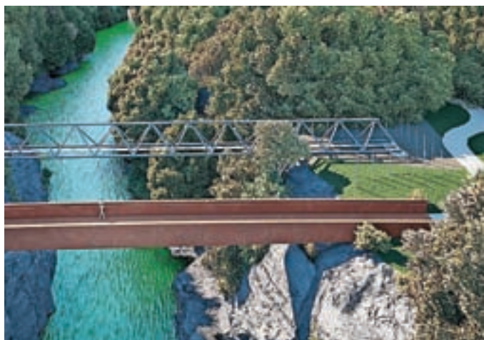
Idejna zasnova mostu čez Kokro

Mestna občina Kranj zaključuje projektiranje povezave za pešce in kolesarje, ki bo povezala športni park in Zlato polje z industrijsko cono IBI ter Primskovim. S tem bodo občani Kranja dobili krajšo trajnostno povezavo tako s športnim parkom kot z industrijsko cono IBI, hkrati pa se bo za javnost odprla dragocena zelena površina ob kanjonu reke Kokre, poudarjajo. Vlogo za izdajo gradbenega dovoljenja bodo vložili predvidoma v začetku leta 2022. V primeru odobrenega sofinanciranja z evropskimi sredstvi bi gradnjo lahko začeli že v drugi polovici leta 2022, projekt pa končali v letu 2023.