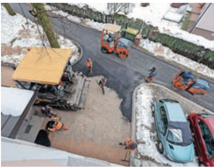
Do konca leta bodo skušali cestišče vsaj grobo asfaltirati.