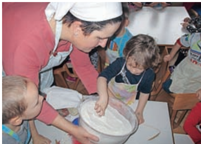
Delavnica peke domačega kruha

Kekec že večkrat sodelovala na sejmu ekošole Altermed, smo potrebovali tudi mleko, jabolka, zelje ... in v tesnem sodelovanju smo dosegli čudovite rezultate: srebrno priznanje za projekt o zelju, zlato priznanje za Kekčevo čežano (novo blagovno znamko) in zlato priznanje za Kekčev jogurt (novo blagovno znamko). Letošnje šolsko leto pripravljamo projekt o korenju. V sodelovanju s kmetijo otrok spoznava živali in odpravlja strah pred njimi. Otrok spoznava in podpira lokalnega pridelovalca, spoznava sezonsko hrano, raznoliko in zdravo. Razvija pozitiven odnos do hrane, se seznanja s postopkom priprave hrane in aktivno sodeluje v procesu priprave in uživanja hrane. Upošteva tudi kulturno dimenzijo in sledi ohranjanju slovenske kulturne dediščine. Otrok razvija tudi predstavo o zmanjševanju odpadkov.